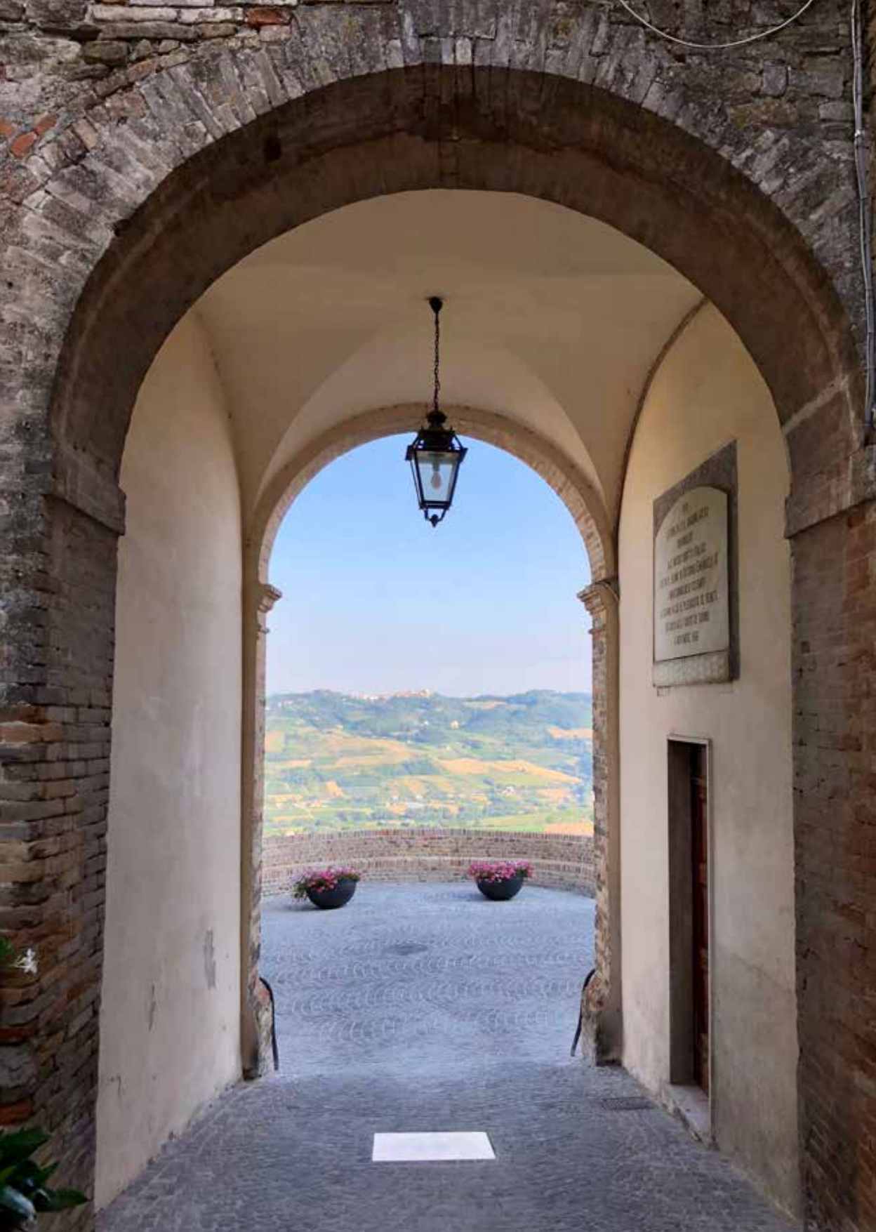
PORTA D'INGRESSO MONTE RINALDO