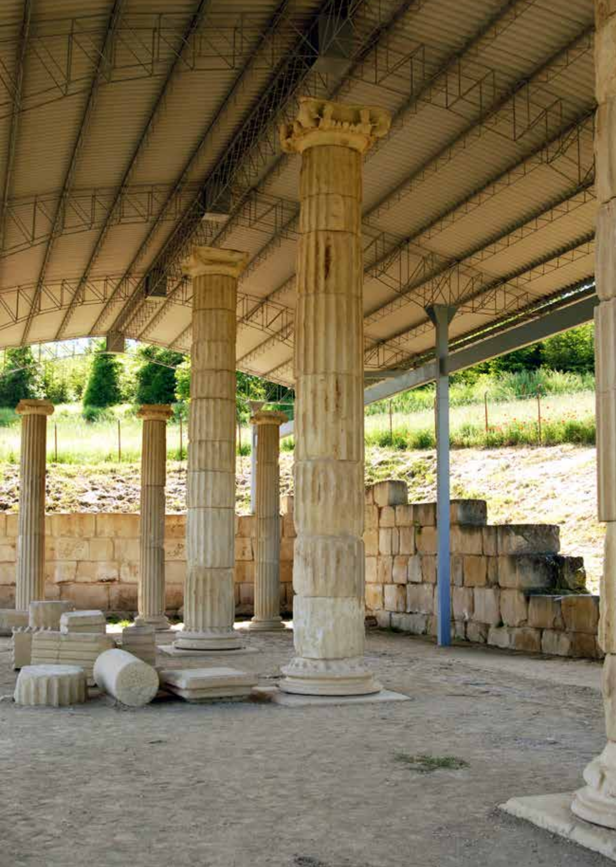
AREA ARCHEOLOGICA LA CUMA - SANTUARIO ELLENISTICO