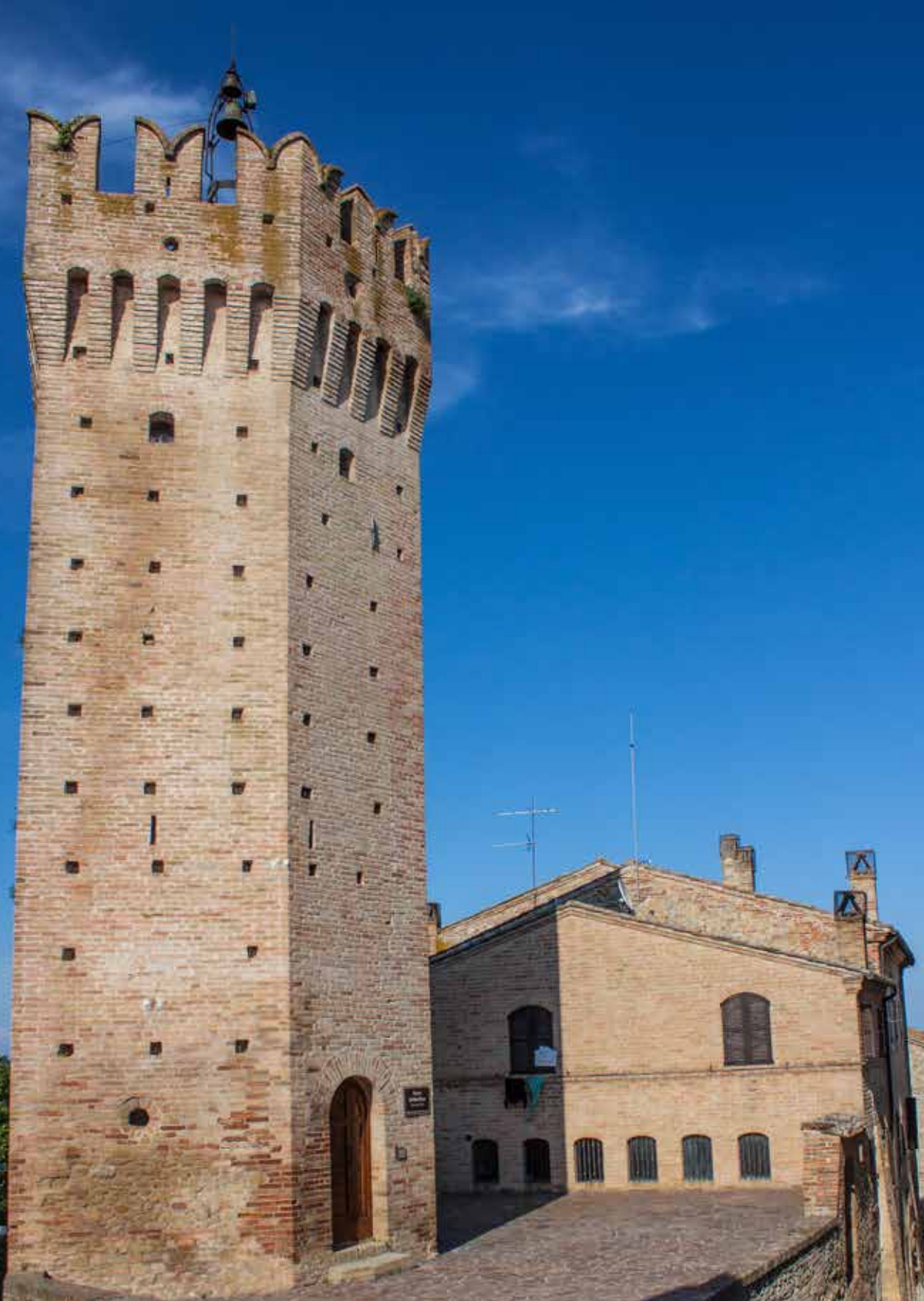
BORGO ANTICO - TORRE Ghibellina