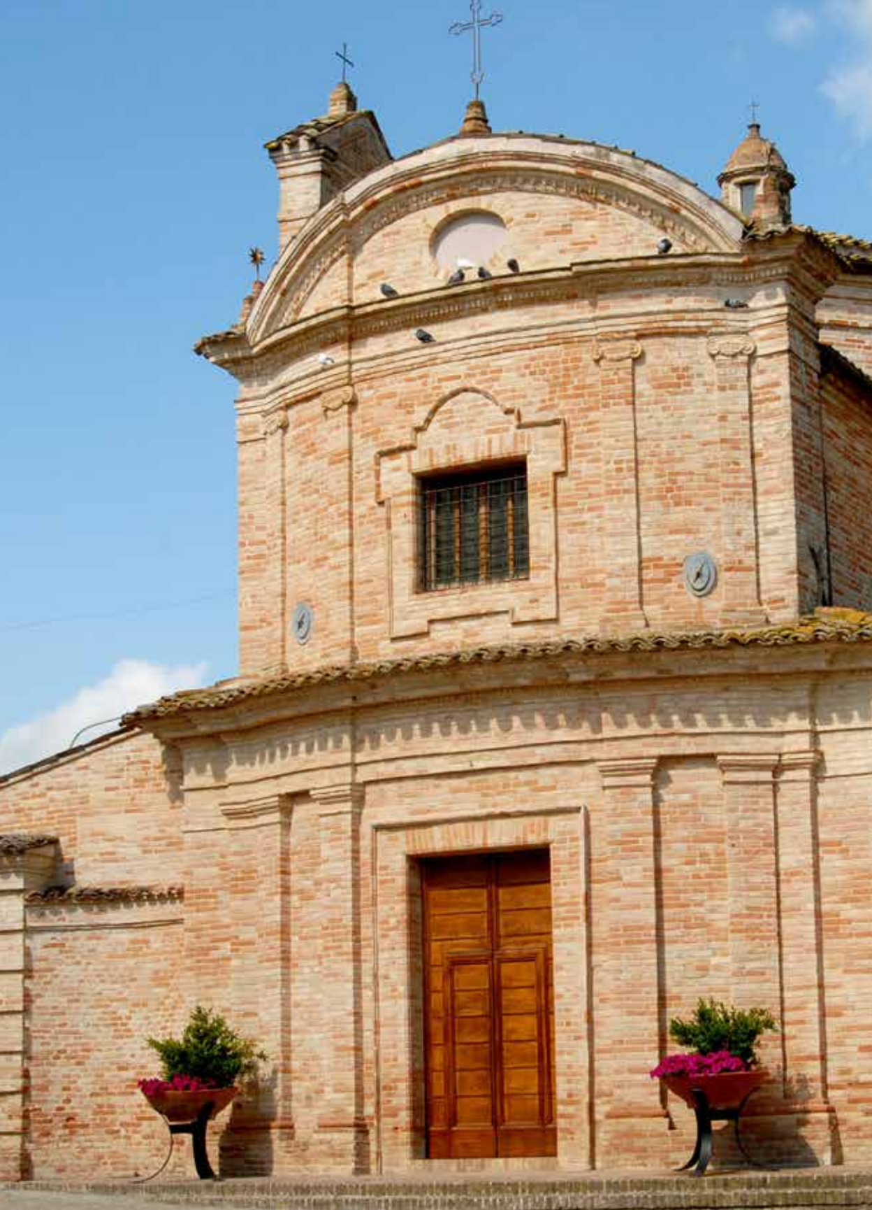
CHIESA DEL CARMINE XVIII SEC.